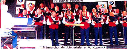
Männerchor der Liedertafel e. V. Köpenick